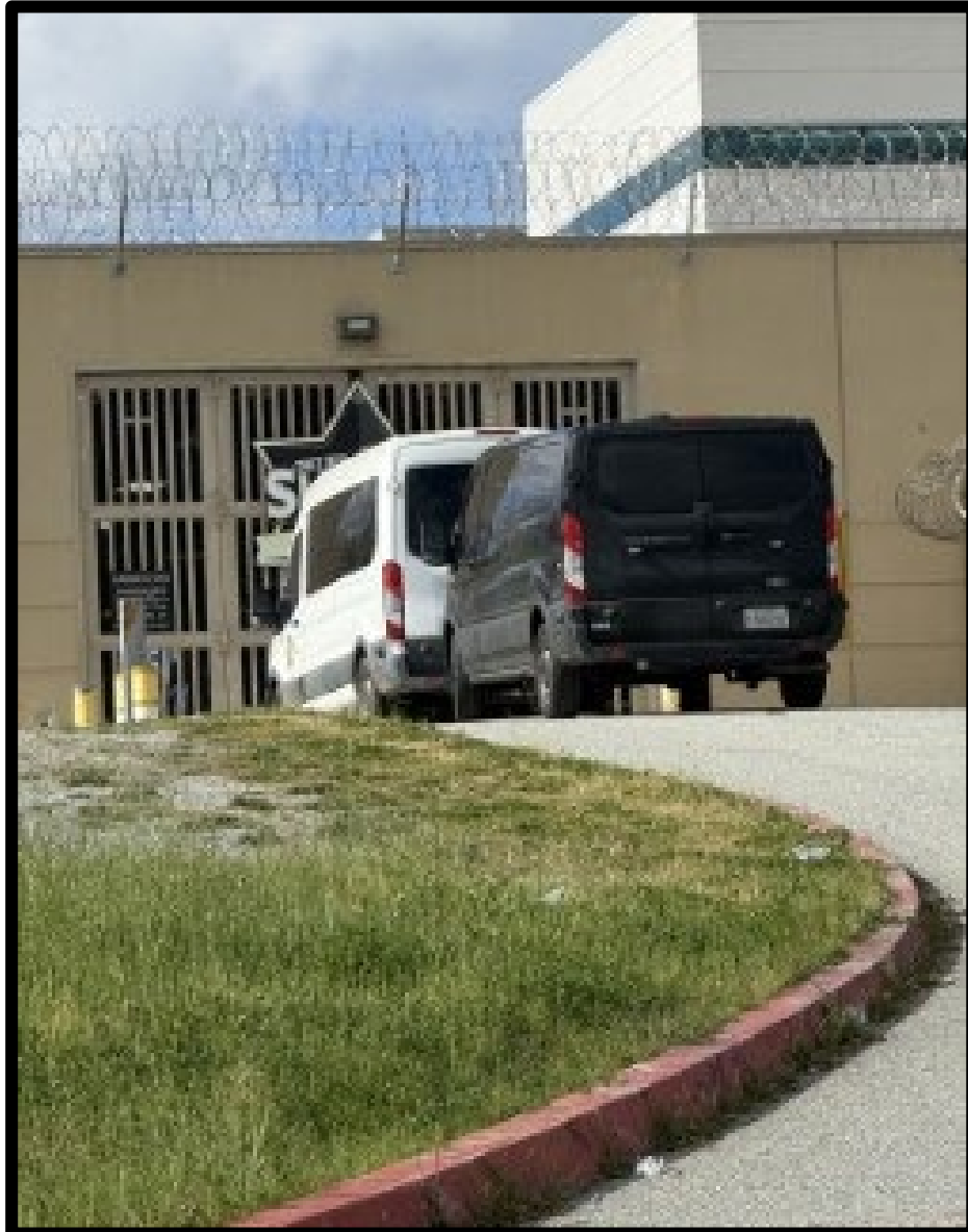
Vehículos de las fuerzas del orden esperando afuera para entrar en la esclusa de seguridad de la cárcel del condado de Monterey.

Los retrasos suelen producirse tras la llegada a la cárcel. El tiempo de transporte es algo previsible e inevitable; sin embargo, el tiempo de espera para iniciar el ingreso y completar el proceso de registro varía significativamente.